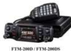
FTM-200D / FTM-200DS